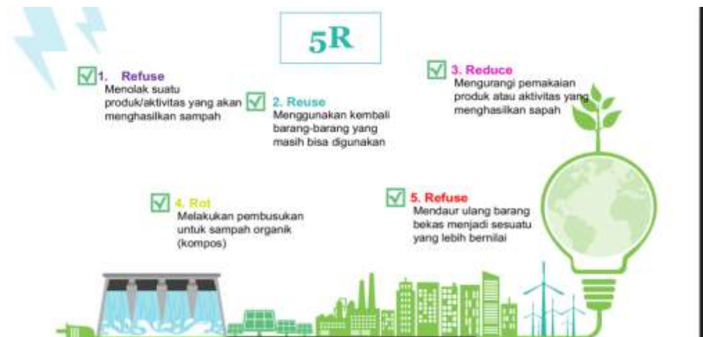
Gambar 3. Mahasiswa mampu mengorganisir informasi yang di dapatkan