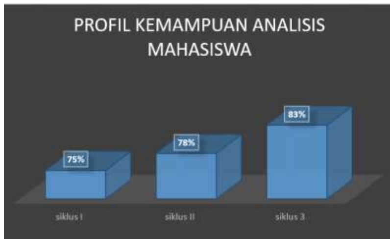
Gambar 1. Grafik Profil Kemampuan Analisis Mahasiswa

Hasil dalam penelitian ini adalah untuk mengetahui profil kemampuan analisis mahasiswa yang sedang menempuh mata kuliah Ilmu Pengetahuan Lingkungan menggunakan siklus PTK yang dilaksanakan sebanyak 3 siklus. Adapun hasilnya dapat dilihat pada grafik di bawah ini: