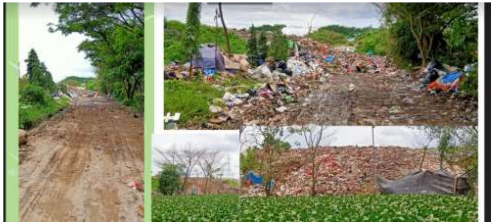
Gambar 2. Mahasiswa mengumpulkan informasi melalui pengamatan lingkungan di sekitar rumah

Kegiatan mahasiswa yang dimaksud untuk mengetahui profil kemampuan menganalisis dapat dilihat pada gambar di bawah ini: