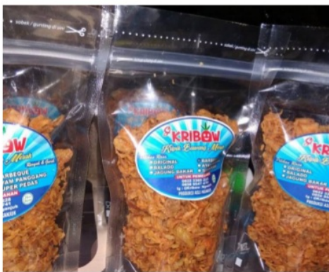
Gambar 1.a. Kripik Bawang Merah “KRIBAW”

Tahap ketiga yaitu business competition. Kegiatan ini dilakukan dalam bentuk lomba produk wirausaha mahasiswa. Dalam tahap ini dilakukan penilaian ide usaha dan prospek usaha. Hal ini dilakukan sebagai upaya mendorong tumbuhnya jiwa wirausaha bagi mahasiswa. Kompetisi dipandang sebagai suatu kesempatan untuk mencari pengalaman baru, meningkatkan kompetensi, dan implementasi bisnis. Dampaknya, mahasiswa dapat memiliki pengalaman baru terkait pemasaran, inovasi produk, keuangan, dan relasi baru (Watson, K., McGowan, P., & Cunningham, J. A., 2018). Kegiatan bazar dilakukan dalam bentuk kelompok yang dilakukan oleh semua prodi yang menempuh mata kuliah kewirausahaan. Produk yang disajikan dalam bazar bersifat bebas, tidak terbatas dengan ilmu pengetahuan ataupun prodinya. Beberapa contoh produk hasil kompetisi mahasiswa dapat dilihat pada Gambar 2. Sebagai contoh Kripik Bawang Merah “KRIBAW”, Kripik Tempe “Wanda” yang telah memiliki izin Pangan Industri Rumah Tangga (PIRT), konveksi pakaian Jati Tailor, budidaya perikanan, budidaya melon, bisnis pialang saham, dan lainnya. Setelah kegiatan bazar, produk-produk terbaik mendapatkan bimbingan khusus untuk diajukan dalam kegiatan Program Kreativitas Mahasiswa (PKM). Hasil yang diperoleh, ada 5 mahasiswa yang lolos mendapatkan pendanaan dari Kementerian Riset, Teknologi, dan Pendidikan Tinggi Republik Indonesia tahun 2019.