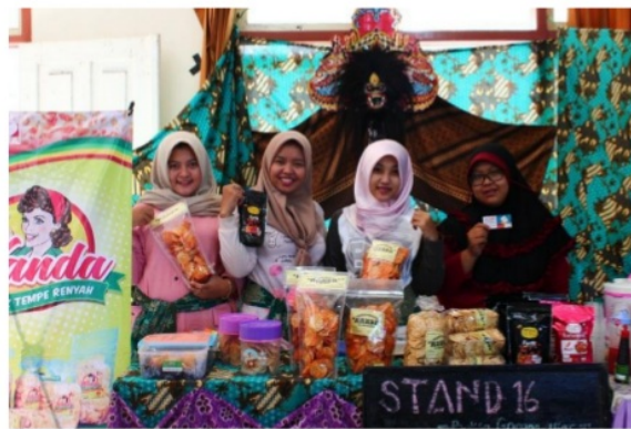
Gambar 1.b. Kripik Tempe “Wanda”