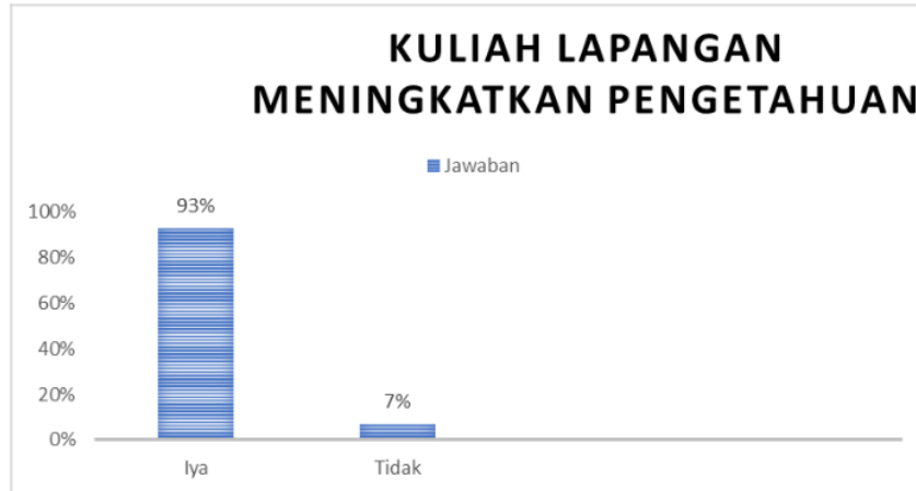
Gambar 3. Hasil Angket

Pada pertanyaan nomor satu ditanyakan apakah kuliah lapangan meningkatkan pengetahuan anda dan sebanyak 98 % mahasiswa menjawab iya. Hal ini sesuai dengan pendapat Ariyansyah (2018) bahwa pembelajaran kuliah lapangan dapat meningkatkan pengetahuan mahasiswa. Hasil ini juga dikonfirmasi oleh wawancara mahasiswa yang menyebutkan nilai UAS memuaskan karena saat mengerjakan soal UAS, mahasiswa menjawab beberapa pertanyaan berdasarkan kuliah lapangan yang telah dilaksanakan. Selain itu, mahasiswa juga dapat mengetahui proses produksi, proses pengemasan dan proses pemasaran, mengetahui cara pengelolaan sumber daya manusia dan alam, mahasiswa dapat mengetahui bagaimana lingkungan internal dan eksternal suatu industry.