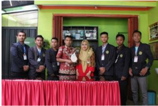
Gambar 1. Kuliah lapangan di CV Bagus Agriseta

Kegiatan kuliah lapangan dilaksanakan pada 22 s.d 23 November 2019. Adapun tujuan kuliah lapangan adalah CV Bagus Agriseta dan Madu Batu di Kota Batu. Dalam pelaksanaan kegiatan ini, mahasiswa dibekali dengan teori mengenai materi Ekonomi Bisnis antara lain kinerja bisnis, pengelolaan sumber daya dan lingkungan industri. Selain itu, mahasiswa juga mendapat pengarahan langsung mengenai aturan, tata tertib dan alur pelaporan kegiatan oleh Kaprodi Pendidikan Ekonomi. Kegiatan berlangsung selama dua hari yang didampingi oleh Dosen Pengampu dan Kaprodi Pendidikan Ekonomi