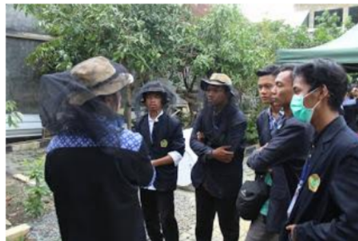
Gambar 2. Kuliah lapangan di Madu Batu