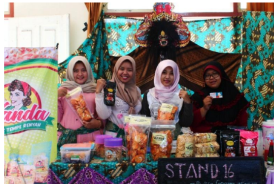
Gambar 1.b. Kripik Tempe “Wanda”