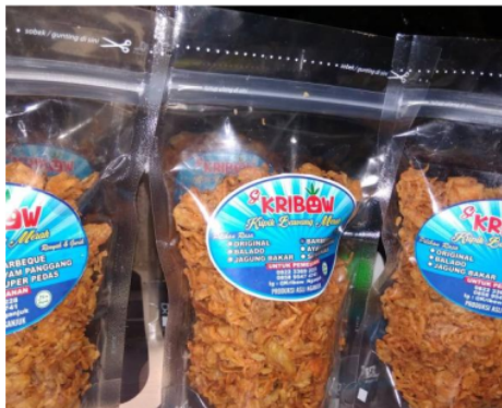
Gambar 1.a. Kripik Bawang Merah “KRIBAW”

Tahap ketiga yaitu business competition. Kegiatan ini dilakukan dalam bentuk lomba produk wirausaha mahasiswa. Dalam tahap ini dilakukan penilaian ide usaha dan prospek usaha. Hal ini dilakukan sebagai upaya mendorong tumbuhnya jiwa wirausaha bagi mahasiswa. Kompetisi dipandang sebagai suatu kesempatan untuk mencari pengalaman baru, meningkatkan kompetensi, dan implementasi bisnis. Dampaknya, mahasiswa dapat memiliki pengalaman baru terkait pemasaran, inovasi produk, keuangan, dan relasi baru (Watson, K., McGowan, P., & Cunningham, J. A., 2018). Kegiatan bazar dilakukan dalam bentuk kelompok yang dilakukan oleh semua prodi yang menempuh mata kuliah kewirausahaan. Produk yang disajikan dalam bazar bersifat bebas, tidak terbatas dengan ilmu pengetahuan ataupun prodinya. Beberapa contoh produk hasil kompetisi mahasiswa dapat dilihat pada Gambar 2. Sebagai contoh Kripik Bawang Merah “KRIBAW”, Kripik Tempe “Wanda” yang telah memiliki izin Pangan Industri Rumah Tangga (PIRT), konveksi pakaian Jati Tailor, budidaya perikanan, budidaya melon, bisnis pialang saham, dan lainnya. Setelah kegiatan bazar, produk-produk terbaik mendapatkan bimbingan khusus untuk diajukan dalam kegiatan Program Kreativitas Mahasiswa (PKM). Hasil yang diperoleh, ada 5 mahasiswa yang lolos mendapatkan pendanaan dari Kementerian Riset, Teknologi, dan Pendidikan Tinggi Republik Indonesia tahun 2019.