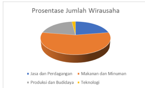
Gambar 1. Prosentase Jumlah Wirausaha

menggunakan Moodle. Ada 3 tahap kegiatan inti yang dilakukan yaitu pemberian motivasi bisnis, proses pembelajaran, dan kompetisi bisnis..